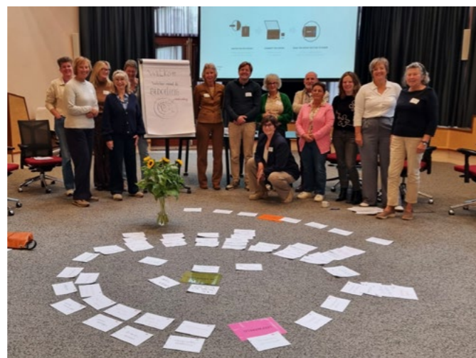
Een van de vijf trainingsgroepen 'Werken vanuit de bedoeling'

Het bestuur is trots op de vrijwilligers en waardeert hun inzet enorm. Vrijwilligers voelen zich omgekeerd ook gewaardeerd voor hun betrokkenheid. De trainingen en bijeenkomsten zorgen niet alleen voor meer verbinding en het opdoen van kennis, maar maken ook die waardering tastbaar.